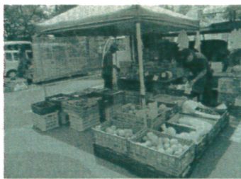
昨年は191件配達依頼が土曜市でした。