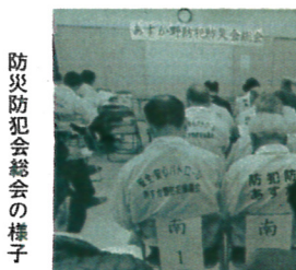
防災防犯会総会の様子