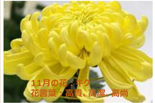
11月の花：キク 花言葉：高貴、高潔、高尚