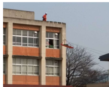
(昨年度の総合防災訓練の様子)