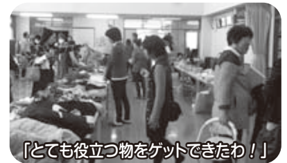
「とても役立つ物をゲットできたわ！」

況でした。出品展示に準備から当日の展示に至るまで、お手伝い頂きました関係者の皆様、ならびに出品して頂いた方々ありがとうございました。