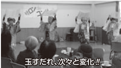
玉すだれ、次々と変化!!

【11月6日】「第7回いきいきサロンdeコンサート」は南京玉すだれ。東大阪から来ていただいた衣装もステキな4人の「河内小梅」嬢さんによる見事な南京玉すだれ。楽しく愉快的口上に合わせ、色々な見立て芸を次から次に繰り出す。「チューリップ～しだれ