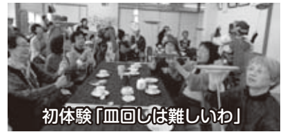
初体験「皿回しは難しいわ」

柳～シャボン玉～鯉のぼり～にさも似たり～との口上と共に4人の玉すだれが一瞬に形を変えていく。古くから伝わる芸に「成る程流石だ!」と観衆は納得と同時に拍手喝采。会場はちょっとした寄席気分になる。今日は「もっときれいにし隊」のゴミ拾いに参加したテニス部も加わりコーヒーをいただきながらの見物。次は皿回し。曲芸の披露のあと観衆の皆さんによる体験の皿回し。観るは簡単、行うは難し。棒の先端にお皿を自分で回すことの難しさ!うまく回ってくれない。しかし、すでに回っているお皿を次か