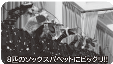
8匹のソックスパペットにビックリ!!

んでみると……！「ハーイ！メリークリスマス！♪」と現れたのは、赤い服・白いおひげのサンタクロースさんです。まみっ子は驚いたり喜んだり！良い子の皆にひとりずつプレゼントを配ってもらってクライマックス！サンタさんを囲んで全員で記念撮影です。「1+1=に〜！」でぱちり。サンタさんありがとう。また来年も来てね♪家族や友だちと過ごす季節ごとの行事は、子ども達の心を豊かにし、また大切な思い出としていつまでも心に残ることでしょ。