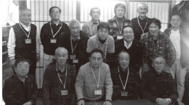
(写真は2016年度世話役の一部の皆さんです)