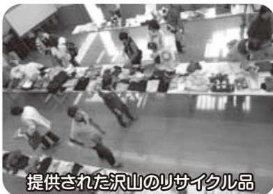
提供された沢山のリサイクル品

【11月13日】7丁目北班ボランティアサークル主催の第2回「不用品リサイクル交換会」を自治会館で開催。雑貨、家電、衣類、食器、おもちゃな