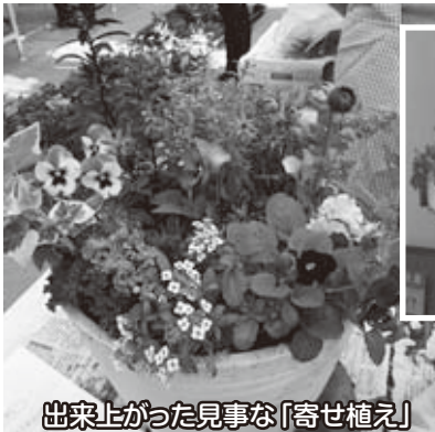
出来上がった見事な「寄せ植え」