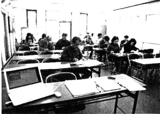
災害対策本部の集計作業

11月5日(土)9時に天理市内で震度6弱の地震があったと想定して、自主防災会による全戸安否確認訓練を実施しました。