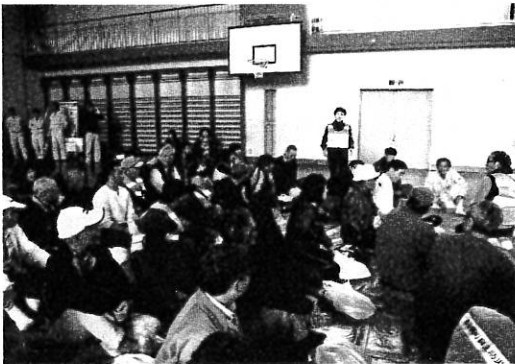
避難所運営訓練の様子

結果は、24地区自治会で2,176人を対象に実施され、安否確認済1,580人、未確認596人でした。この訓練成果をもとに、問題点を班員で再検討して、次からの防災訓練に生かしていきたいとのことです。