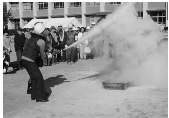
思わぬ方向へ 意外と難しいんです