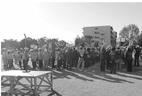
4自治体が第三小学校に集合