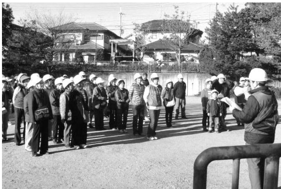
中央公園に集合。ヘルメットをかぶり行程などの説明を聞く参加者

第三小学校校庭で、高塚台1・3丁目自治会、高塚台2丁目自治会、オブザーバー参加の泉台自治会と合流し、開会式が行われました。