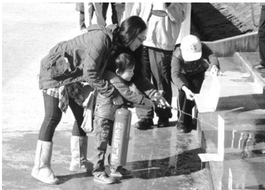
水消火器を使って 上手に倒せるかなあ～