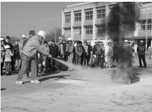
消火器を使っでの消火訓練

開会式の後、それぞれの自治会を3班に分け、西和消防署の方々のご指導のもと、消火訓練、応急訓練、煙避難訓練を20分3交代で行いました。消火器や水消火器を使った消火訓練、三角巾による応急手当や毛布の担架づくりなどの応急救護訓練は昨年とほぼ同様の内容でしたが、なかなか思うように行動することができず、繰り返し訓練することの大切さを実感しました。