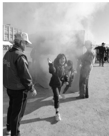
煙とともに飛び出す子どもたち

今年度は、初の試みとして合同防災訓練を行うこととなりましたが、予定時間より1時間も早く終わるなど、手際よく、滞りなく終えることができました。