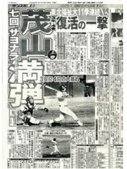
サンケイスポーツ (H23.8.29) 掲載

9連覇を決める逆転ホームランやご家族が観戦に訪れた中での満塁逆転ホームランなど、チャンスに強いスラッガーです。