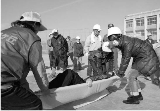
毛布で担架をつくって搬送。 よいしょ！