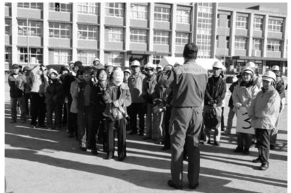
参加者からの質問にも丁寧にお答え いただきました