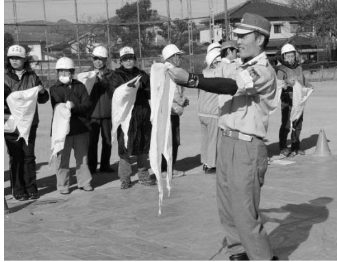
三角巾や風呂敷を使って 応急手当