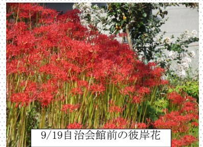
9/19自治会館前の彼岸花