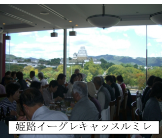
姫路イーグレキャッスルミレー