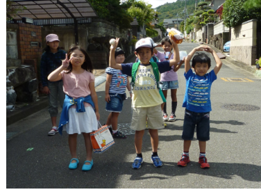
緑ヶ丘最高齢は98歳の方でした。