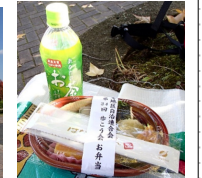
おつかれさまでした