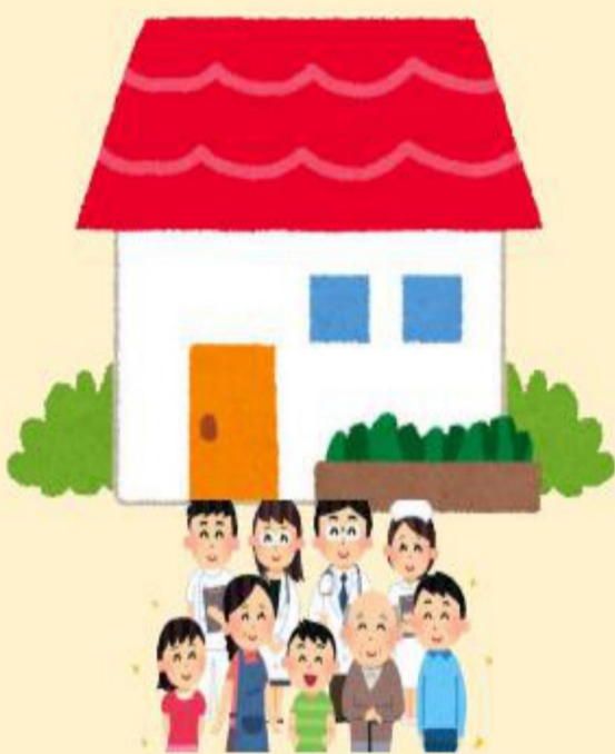
奈良県西和地域7町の医療と介護の連携システム 「西和メディケア・フォーラム」