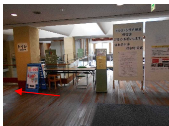
左側にカフェあり、左折します