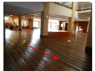
エレベーターをおり、すぐ右に歩いて行くと