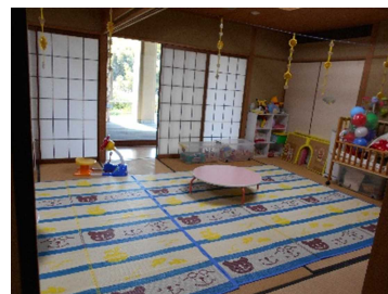
広場の中はこ～んな感じです