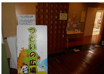
左側に『やすらぎの家』和室「つどいの広場」の看板があります