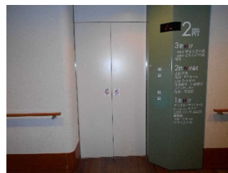
エレベーターで1Fへ