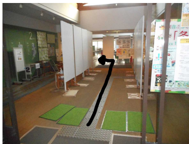
2. 左へ曲がり階段へ向かいます。