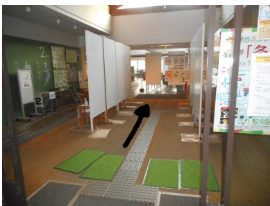
1. 『豆山の郷』玄関を入ります。