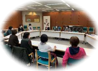
見守り評価会議の様子