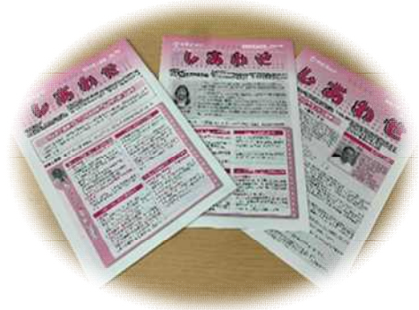
社協だより広報誌『しあわせ』