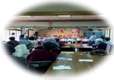
いきいきサロンの様子