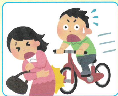
自転車による事故