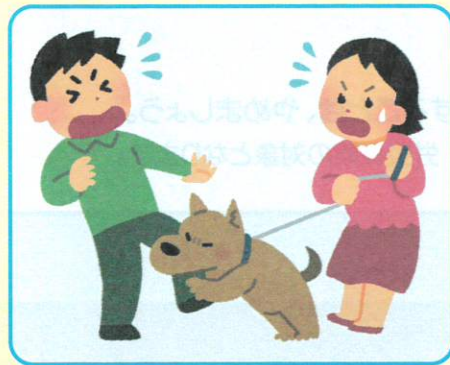
他人のペットによる負傷