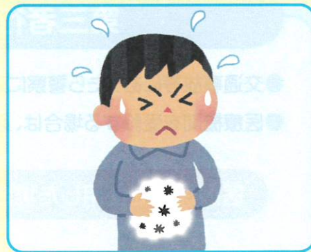
購入品や飲食店などでの食中毒