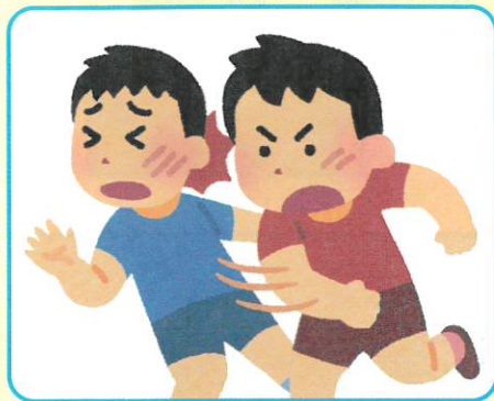
ケンカや暴力行為による負傷