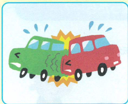
交通事故(車同士やバイク等)