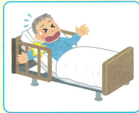
他者所有の施設内や物による事故