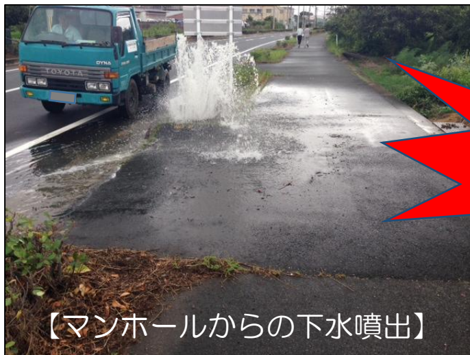
【マンホールからの下水噴出】

【原因】 雨水を流す雨樋などの排水が、「污水管」につながれていることや雨天時に汚水ますの蓋を開けて宅内の雨水を排水していること等が原因です。