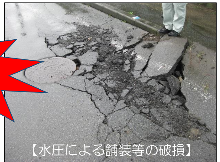
【水圧による舗装等の破損】

【被害発生】 平成26年8月の台風11号の時に、雨水が下水管へ流れ込み、マンホールから下水が溢れ出たり、水圧により舗装等が破損する事故がありました。（※写真は、奈良県内他町のケースの写真です）