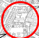
河合第三小学校跡地