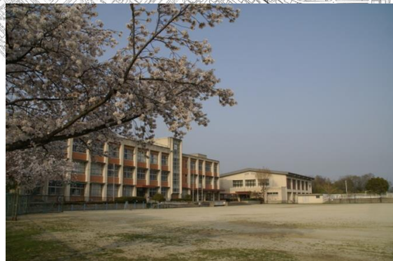
河合第三小学校跡地