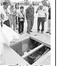
姫路城の放水設備

姫路城では、消防署勤務から管理事務所に再任用されている方に国宝をどのように火災から守っているのか案内していただきました。防災という視点で眺めると、さりげなく梁が鉄板で補強、監視カメラは細長い木箱に、歩いている進行方向からは見えませんが振り返ると、梁に散水用の配管があちこちに走っていました。薄暗い天守も国宝なので電気が引けないと聞いて、良く見れば電池式の蛍光灯が階段の手すりに取り付けられていました。研修の目玉は、天守閣下の広場地下に設けられた放水設備の天板を開けて説明していただいた事。広い城内で国宝を壊さない様に、如何に消火体制を取るか。文化財を守るという事について深く考えさせられる研修でした。