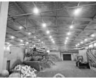
トンネルコンポストの設備

すぐには無理だろうが、生駒市でもゴミ処理施設を更新する際は、この「トンネルコンポスト方式」を採用してほしいものだと感じた。