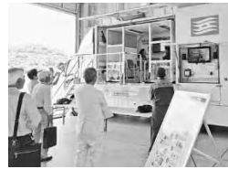
起震車による地震体験

両施設の見学・体験を通じて大変有意義な内容で、今後の自治会の活動を考える良い機会となりました。