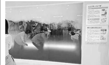
煙の中での避難訓練