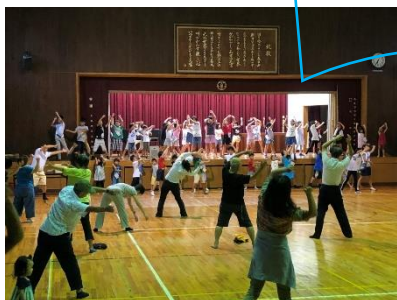
雨の日は体育館で体操

今年は8月18日(日)から夏休み最終日の25日(日)までの8日間にわたり、大宮小学校運動場でラジオ体操が行われました(写真上)。