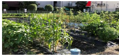
トウモロコシやミニトマトが実っていました