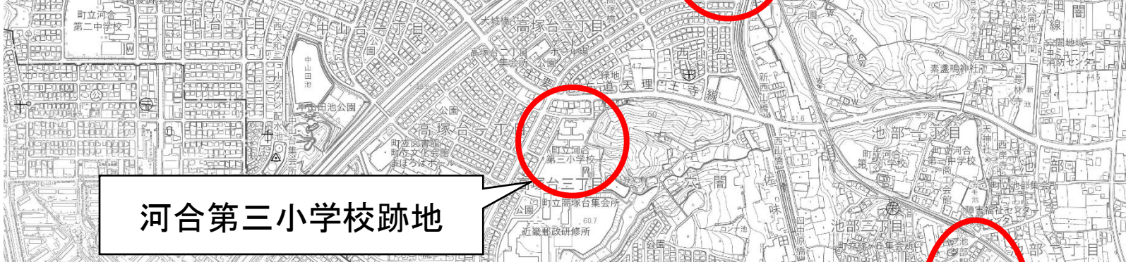
河合第三小学校跡地