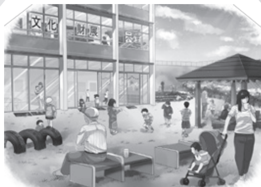
※交流ゾーンのイメージ

2月からこの内容でタウンミーティング実施の予定でしたが、1月中旬からの新型コロナ感染拡大状況を考慮し、この形式での意見募集とします。