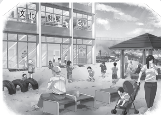
※交流ゾーンのイメージ

2月からこの内容でタウンミーティング実施の予定でしたが、1月中旬からの新型コロナ感染拡大状況を考慮し、この形式での意見募集とします。