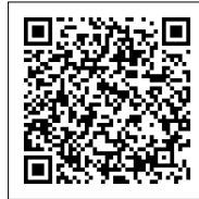
うめの みちよ 梅野 美智代